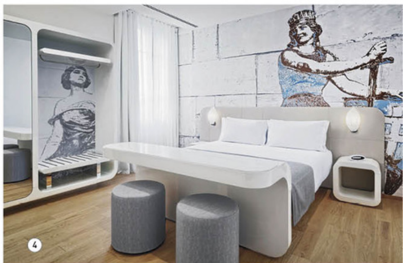
3. Ausonia Hungaria. Ph Andrea Sarti 4. Ausonia Hungaria. Ph Andrea Sarti 5. LORDS OF VERONA luxury apartments. Ph by Juergen Eheim