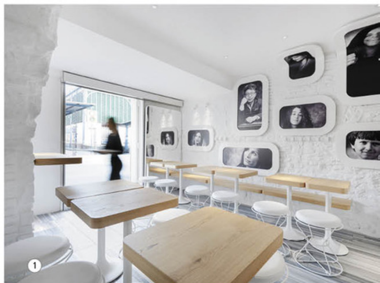
1. 3DDI' restaurant. Ph by Juergen Eheim 2. 3DDI' restaurant. Ph by Juergen Eheim

С.М.: Новые идеи, которые порождают мои проекты, являются результатом непрерывного и удивительного вдохновения, которое я нахожу в отношениях с моими любимыми, в путешествиях, в посещении новых стран, в книгах, в повседневной жизни и моей личной привязанности к жизни. Я считаю, что я счастливчик: никогда не начинаю придумывать проект просто на листе или в iPad, удаляя и рисуя идеи заново. Прежде чем я использую бумагу или более продвинутое устройство, идеи рождаются в моей голове, и я никогда не забываю их смысл.