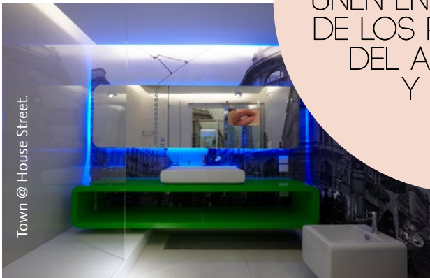
Town @ House Street.