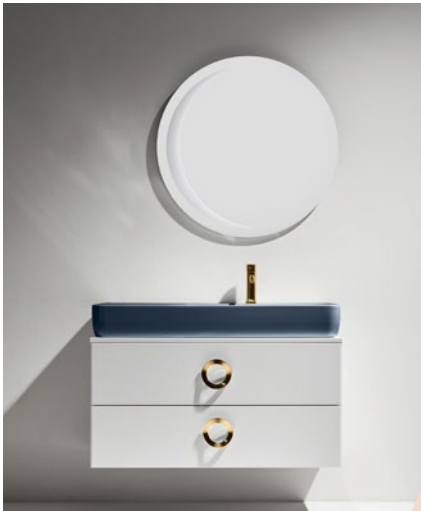
Henges by Simas.

SOSTENIBILIDAD, COMPATIBILIDAD Y VALORES SENSORIALES SE UNEN EN CADA UNO DE LOS PROYECTOS DEL ARQUITECTO Y DISEÑADOR ITALIANO