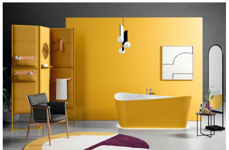
Infinite de Novellini.