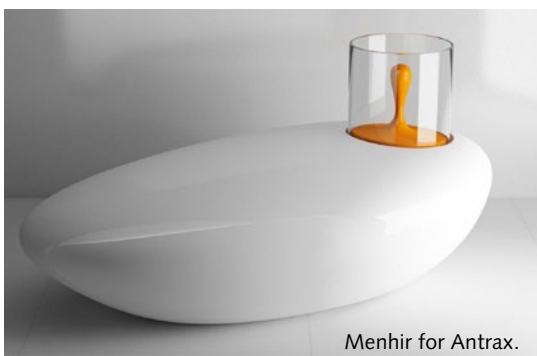
Menhir for Antrax.