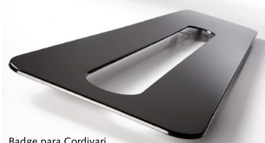
Badge para Cordivari.