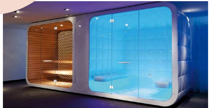
Modular system. Steam Bath & Shower for Aqua special wellness industry.