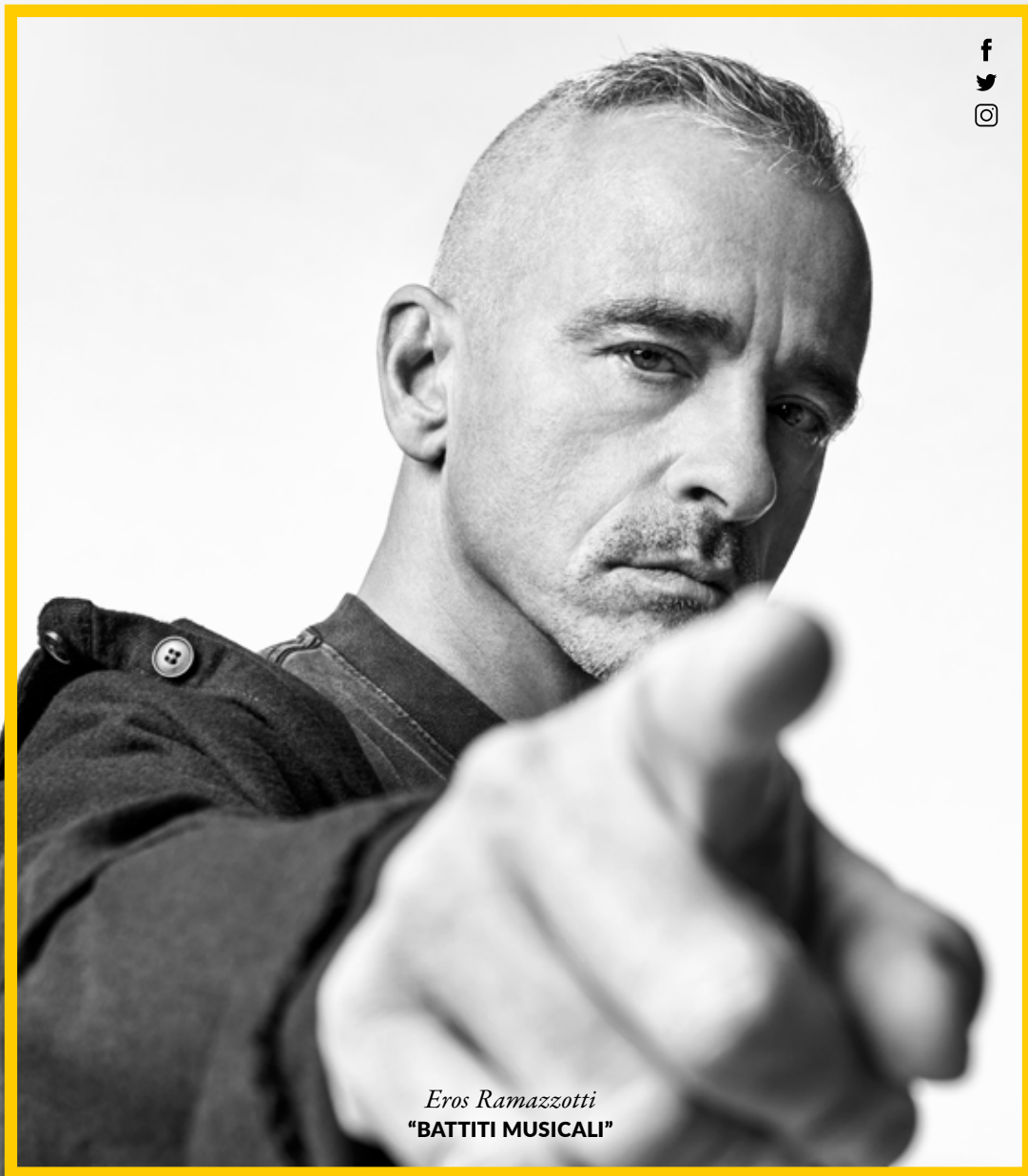
Eros Ramazzotti "BATTITI MUSICALI"